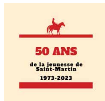
Logo des 50 ans