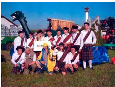
Photo de groupe au giron du Crêt en 2001

Afin de marquer le coup des 50 ans de la Jeunesse, une fête est organisée pour les 16-17 juin prochain. A cette occasion, une soirée ouverte à tous sera organisée le vendredi. Le samedi, lui, sera réservé aux anciens membres et accueillera un rallye dès le début de l'après-midi ainsi qu'une soirée sur le thème de la Country ! Vous avez fait partie de la Jeunesse et n'avez pas reçu d'invitation ? N'hésitez pas à nous contacter au 079 900 86 28 pour y remédier !