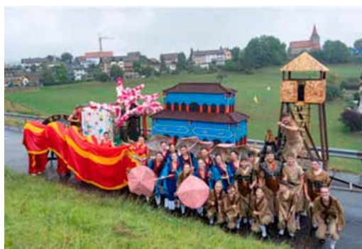
Photo de groupe à Granges en 2022