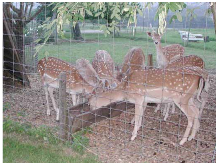
Les daims à la mangeoire