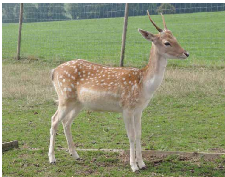
Un tout jeune mâle (daguette)