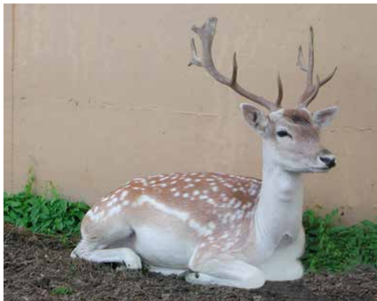
Un superbe mâle au repos

Ces animaux se nourrissent principalement d'herbe fraîche mais aussi de pain sec, de fruits et de légumes et, en hiver, de foin et de maïs. Ils ne demandent pas beaucoup de soins : il faut les vermifuger une fois par année et surveiller leur bonne santé. Ils ont besoin d'un abri mais supportent tous les temps.