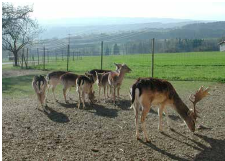
Le troupeau de daims dans son parc à Besencens

La gestation dure entre 225 et 234 jours et chaque daine met bas un faon qui pèse de 2,5 kg à 5 kg à la naissance.