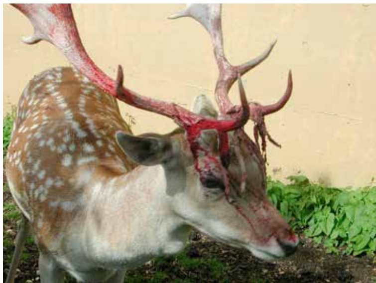
Un mâle lors de la perte du velours