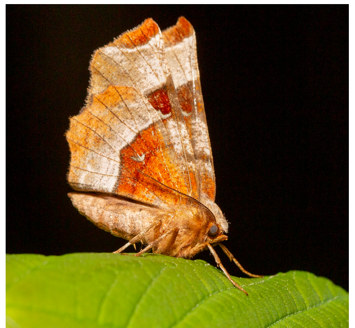
L'Ennomos illustre ( Selenia tetralunaria ) Géomètres