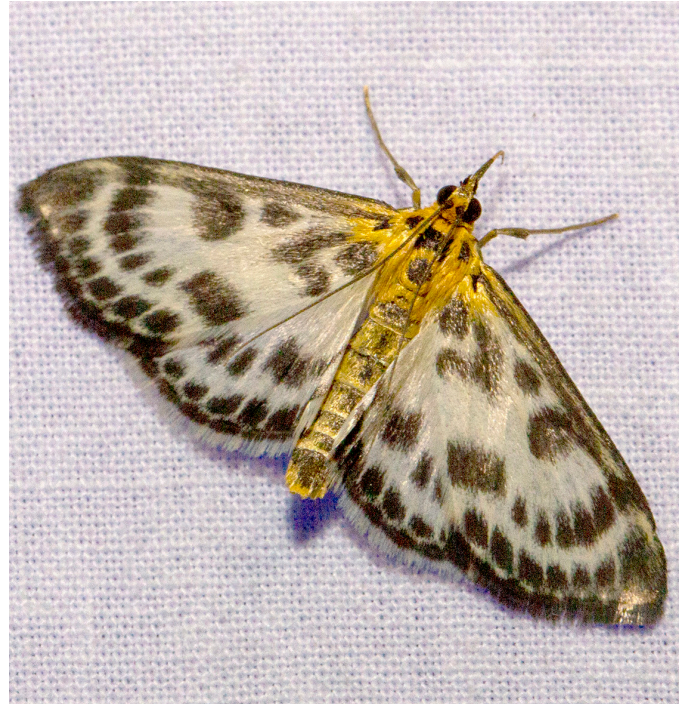
Pyrale de l'ortie ( Anania hortulata ) Pyrales