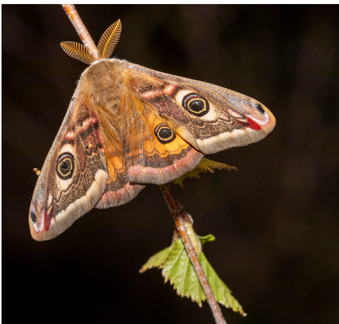
Petit Paon de Nuit mâle ( Saturnia Pavonia ) Bombyx

Par curiosité et passion, j'avais aussi envie de savoir quels sont les papillons que j'allais trouver ici chez moi à Saint-Martin. Ni une ni deux, j'ai sorti mon matériel photographique à plusieurs reprises et j'ai eu plus de