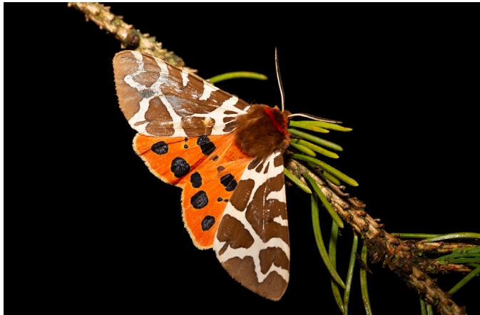
L'Écaille martre ou La Hérissone ( Arctia caja ) Noctuelles