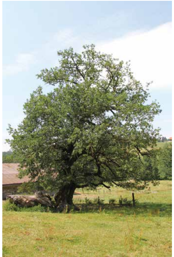
« Le Vainqueur », un chêne âgé, arbre remarquable du sentier

Assemblée constitutive de l'Association du Sentier des Arbres 16 mars 2016 à 20 heures Restaurant La Croix Fédérale