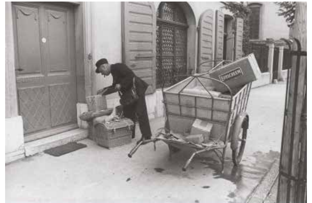
Distribution du courrier à Bulle en 1942

Un grand merci à Simone qui nous a livré avec enthousiasme ses souvenirs.