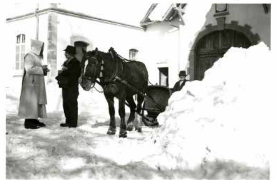
Distribution du courrier à La Valsainte en 1930, lors d'un hiver bien enneigé