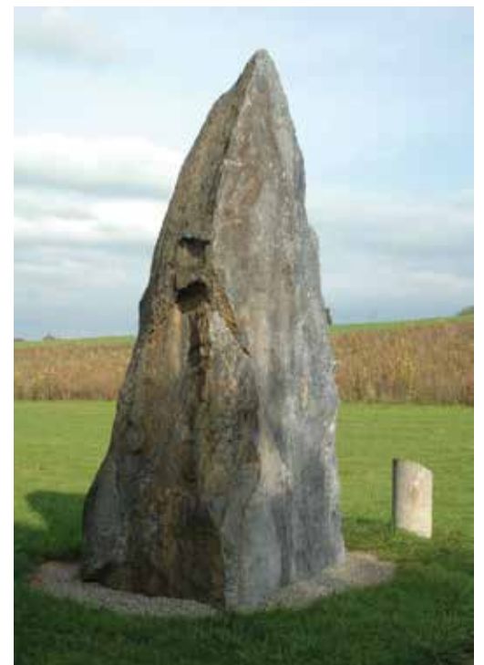
la « Pierre du dos à l'âne », Essertes

Un autre bloc se cache dans le bois de l'Erberey, sur la commune de Chésalles-sur-Oron. Selon la légende, ce bloc appelé « Pierre Blanche » serait l'un des projectiles décochés par Gargantua à l'aide de sa fronde pour se venger du diable.