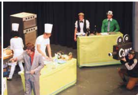
l'équipe de Le Crêt à l'oeuvre