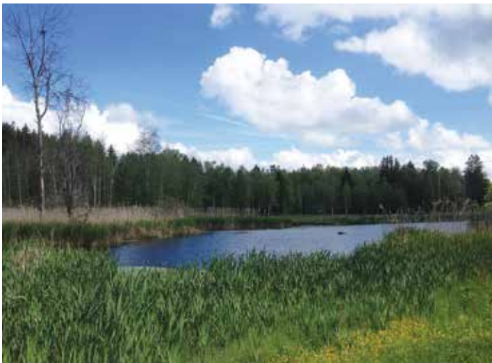
étang du collecteur