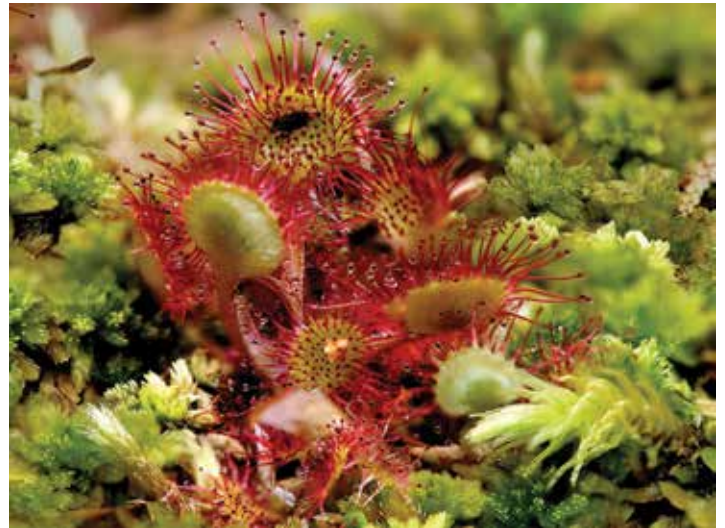
plante carnivore, la drosera

A noter qu'il existe d'autres tourbières dans la région, comme par exemple au nord de Fiaugères, au Crêt ou au Lac Lussy.