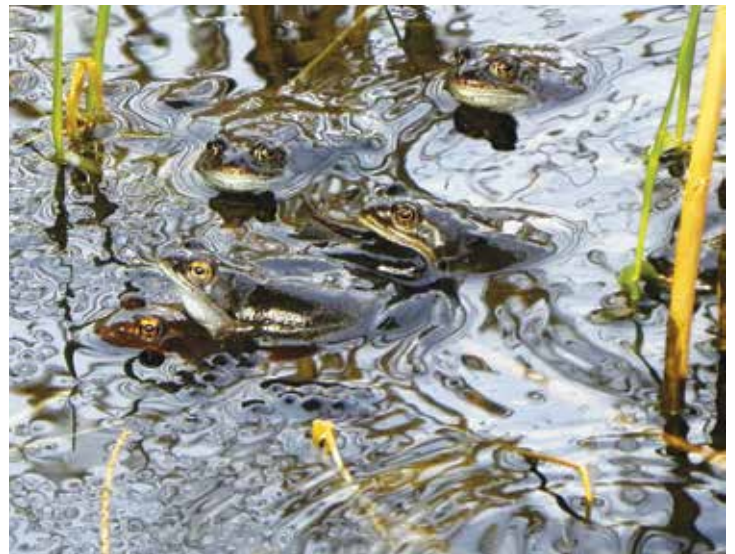
des grenouilles rouges au moment de la ponte

Après de longues tractations, il est devenu possible de réaliser un ouvrage permanent et fonctionnant dans les deux sens le long de la route du Jordil. La première étape des travaux, consistant à surélever la route, fut réalisée en 2012. En 2014, une fois la chaussée stabilisée, quatre tuyaux d'un diamètre de 80 cm furent posés à travers la route, avec des murets en béton de part et d'autre afin de conduire les bêtes vers les passages. Il sera intéressant de suivre le fonctionnement de l'ouvrage dès ce printemps.