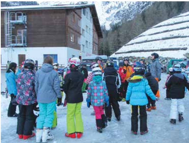
devant le chalet

Merci à toutes et tous et à l'année prochaine !