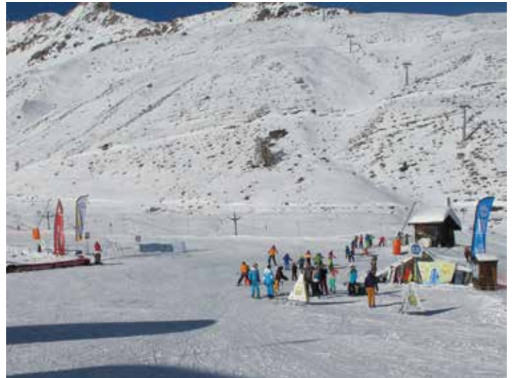
la station de Grimentz