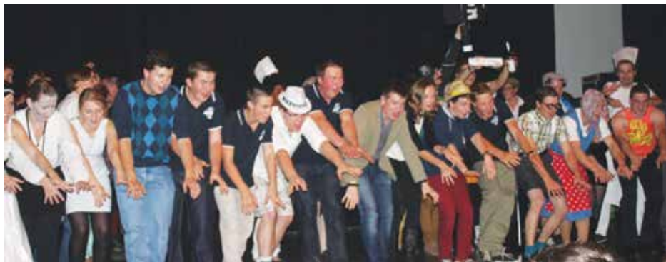
les acteurs de Sketch up en farandole

Néanmoins, nous profitons de ce journal pour mentionner que des réflexions sont en cours sur la poursuite de ces festivités et sur la forme que prendra notre prochaine fête. Nous vous en tiendrons informés dans le prochain journal communal.