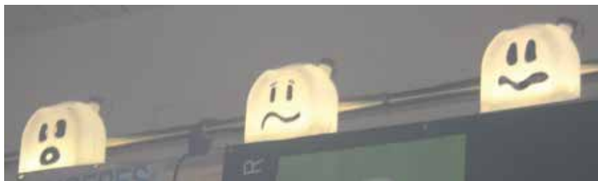
et quelques fantômes