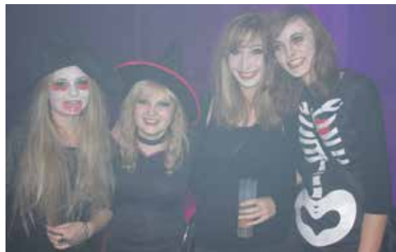
de bien jolies sorcières