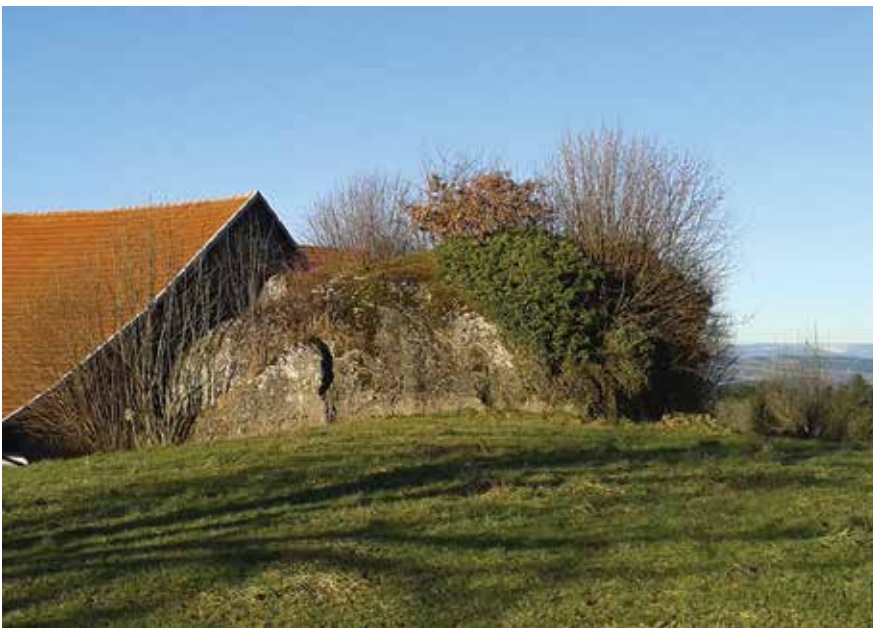
le bloc erratique à la Jailla, Besencens

Les blocs erratiques ont souvent été utilisés comme ressource économique, particulièrement dans des régions dépourvues de pierres de construction où ils faisaient office de carrières. Leur destruction pour servir de matériaux de construction a mené à leur recensement et à leur protection dès le milieu du XIXe siècle, ce qui peut être considéré comme le premier mouvement de protection de la nature en Suisse. En effet, dès 1838, alors que seuls quelques savants sont convaincus de leur origine glaciaire et que cette hypothèse paraît encore extravagante, « la Pierre à Bot », à Neuchâtel, devient le premier site protégé de Suisse.