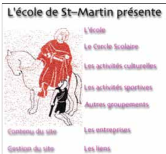
Site de l'école : www.st-martin-fr.ch/fr/