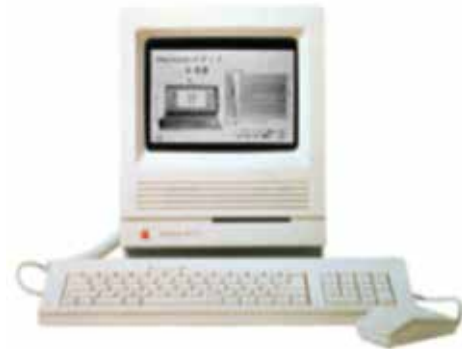
l'ordinateur Mac SE

MITIC (Médias, Images et Technologies de l'Information et de la Communication) inscrites aujourd'hui dans le PER (Plan d'Etude Romand) et Fri-Tic (le centre MITIC fribourgeois) n'étaient que des mots virtuels, des notions en devenir ! Et pourtant certaines de nos classes étaient déjà dotées d'un ou deux « ordis », notamment la 5-6P d'alors.