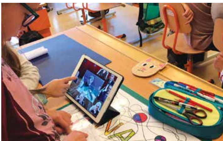
Le plumier co-existe avec la tablette iPad.

Certaines classes font même du « one-to-one », c'est-à-dire que chaque élève possède son propre iPad. L'idée maintenant, avec l'utilisation des tablettes, n'est pas que de faire des jeux d'entraînement - on en fait un peu - mais de faire de l'interactivité, c'est-à-dire que les élèves créent divers documents à l'aide d'applications faciles à utiliser. Il font donc du français, par exemple, sans s'en rendre compte. La rapidité avec laquelle ils entrent dans une nouvelle application est impressionnante.